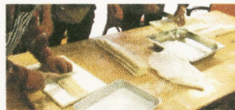
麺も手作り「侶うどん」

料理のお手伝いを して下さる方を 募集しています。土 曜日のお昼に時間 が取れる方で、料理 が得意な方、やっ てみたい方、ご連絡を お待ちしております！