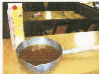
これが秘伝のダシ！