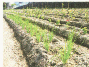
薬味のネギは別売りいたします（一束50円）

ひとりでお住まいの方はもちろん、 お子さんやご近所さんと一緒に、 心もからだも元気になりませんか？